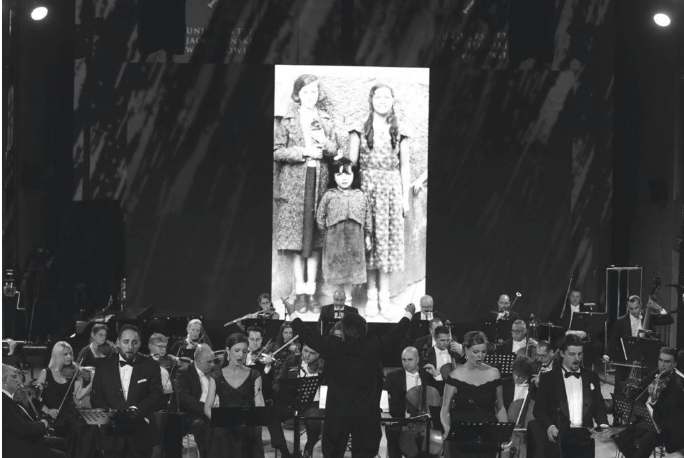
Abbildung 3: Aufführung des Requiem s für Auschwitz am 1. August 2019 in Krakau durch die Roma und Sinti Philharmoniker.

und Wiesbaden sind dabei keine Einzelfälle. Gerade der Einsatz von Fotografien ist häufiger Bestandteil der Requiem -Aufführungen. So werden weitere indexikalische Verbindungen zwischen dem Requiem und konkreten Erinnerungsinhalten geknüpft, wie auch die Aufführung in Krakau im Jahr 2019 zeigt.