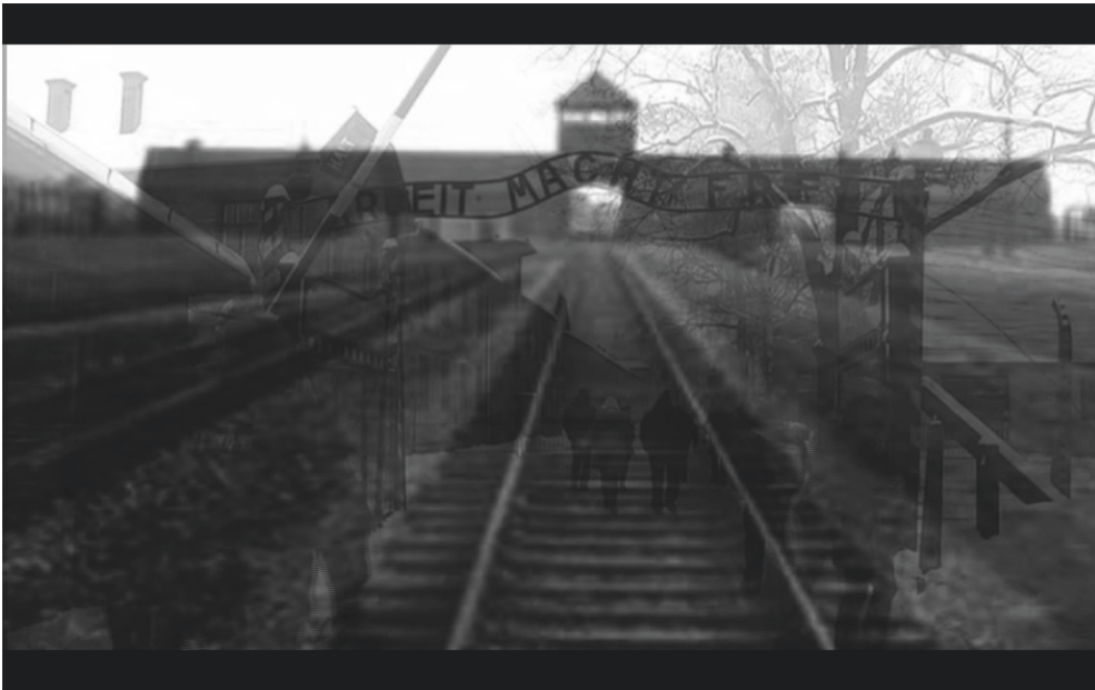
Abbildung 1: Requiem für Auschwitz – Making Of (00:04) – Verbindung früher und heute am historischen Ort

(00:00–01:17). Das Making Of öffnet mit einer Remediation von historischem Bildmaterial: einem Foto des Eingangs des Vernichtungslagers Auschwitz-Birkenau. Das Hereinzoomen auf den Wachturm im Hintergrund simuliert eine Kamerafahrt entlang der Schienen. Währenddessen ertönen die Glocken und Pauken, die auch das Requiem für Auschwitz eröffnen. Die Szene wird überblendet mit einer Filmaufnahme des Tors des Arbeitslagers „Arbeit macht frei“. Obwohl in schwarz-weiß, ist erkennbar, dass es sich um ein aktuelleres Bild handelt. Bei genauem Betrachten sind Besucher*innen der Gedenkstätte unter dem Tor zu erkennen. An dieser Stelle werden Vergangenheit und Gegenwart filmisch miteinander verwoben, und es wird eine Verbindung zwischen dem Erinnerungsort Auschwitz und dem musikalischen Werk hergestellt.